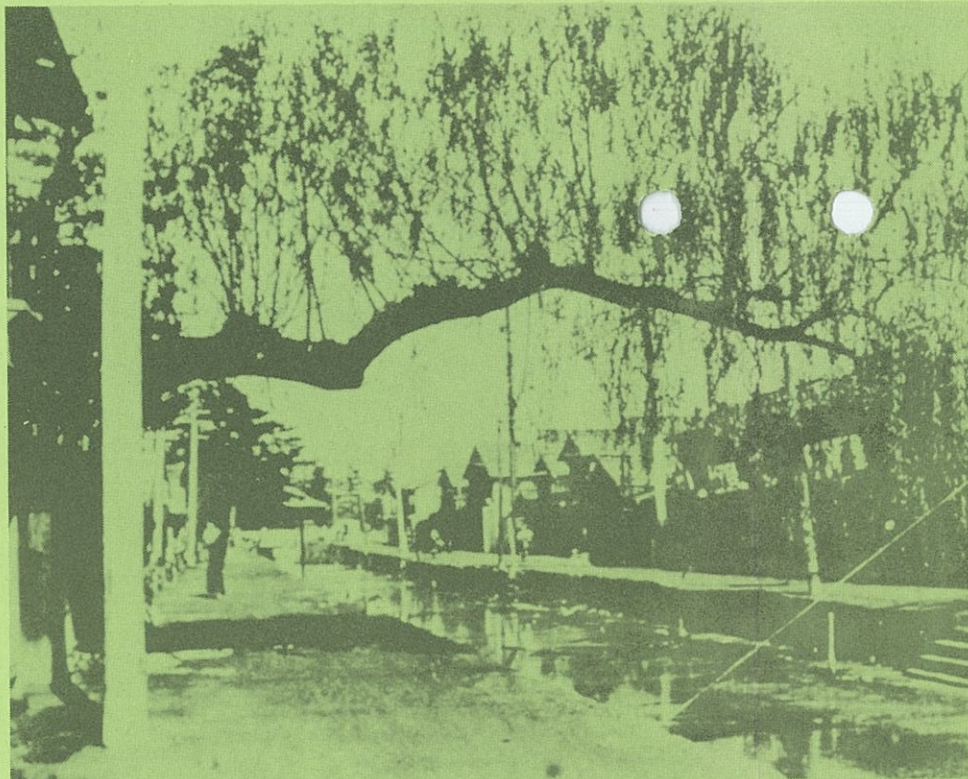
和田見川をはさんで右手が元松江分の伊勢宮町、左手が和田見町である。左手奥の森は売布神社

明治41年(1908年)11月8日松江駅が開業した。全市は喜びに包まれ、5万人の見物人で賑わったという。 その頃、松江駅周辺は一面低湿の水田地帯で、旧藩時代は藩主の鷹場であった。明治41年3月、駅の敷地が決まり埋め立て工事に着手。これと前後して駅と市街地を結ぶ県道東林寺線(駅前通り)の工事が始められ、駅に向かって東西に幅十間(約18m)の砂利道ができ、誓願寺後堀(和多見川とも言う。現在の新大橋通り)に松江橋(現在の朝日町十字路)が架けられた。当時、この橋から東林寺通りまで墓地が続き、南に天神川の土手と田中荒神の森、北に売布神社の森と松花橋(伊勢宮小橋とも言う)、新地遊廓の先に大橋川に沿って御手船場の舟小屋